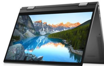
Режим тип „палатка“