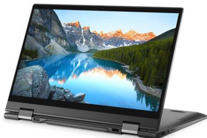
Режим „изправено положение“